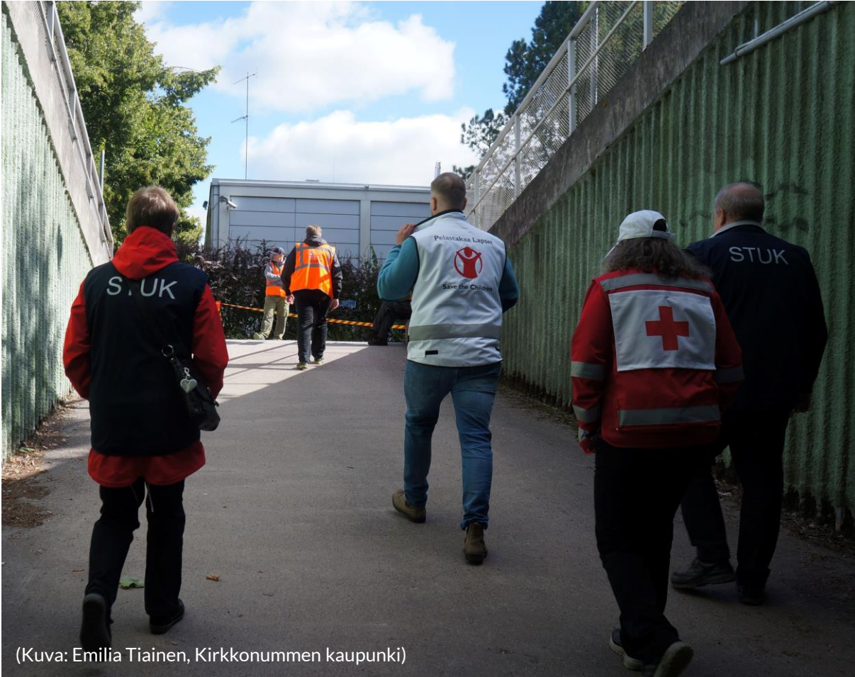
(Kuva: Emilia Tiainen, Kirkkonummen kaupunki)